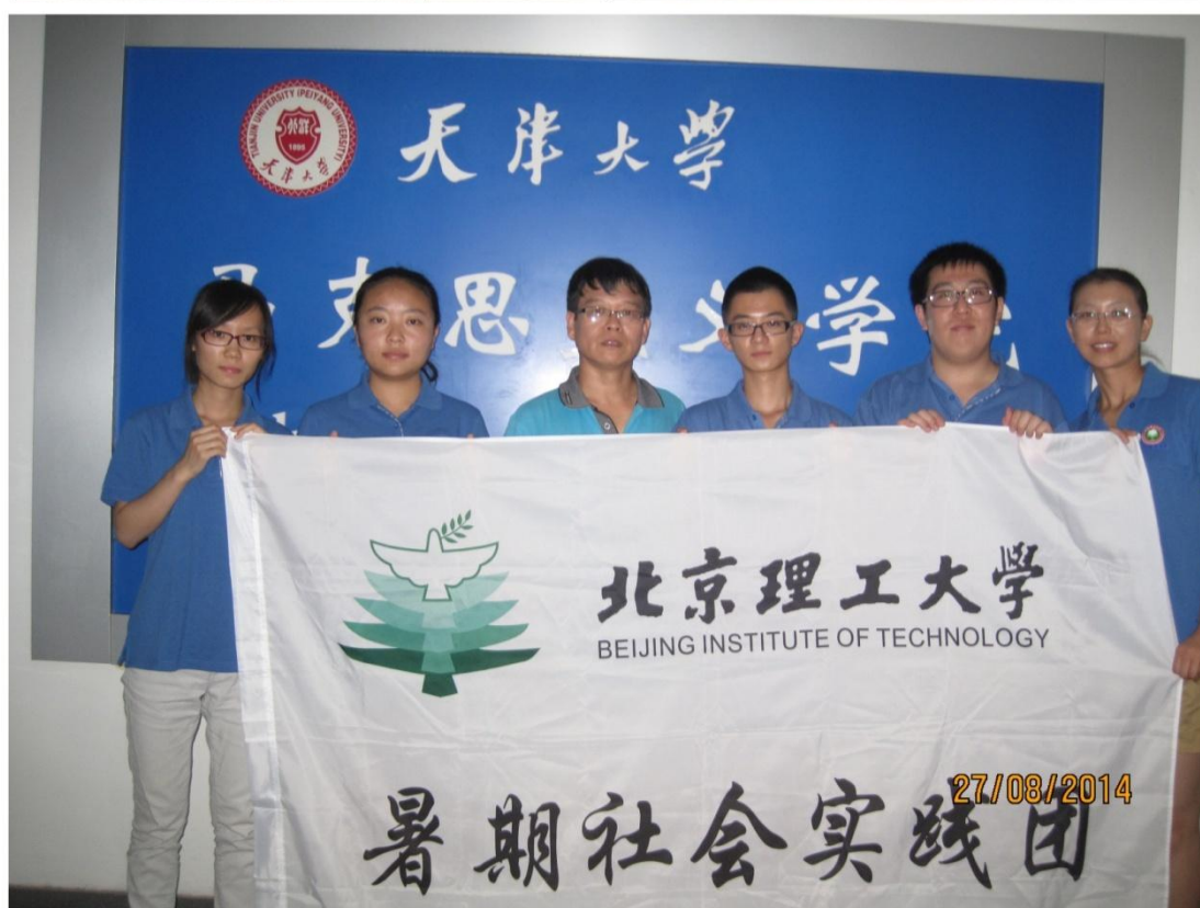
(在天津大学马克思主义学院交流)