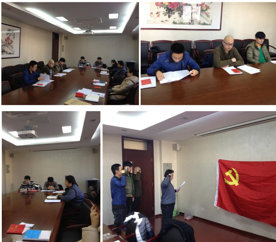
(学生党支部召开讨论接收预备党员大会)