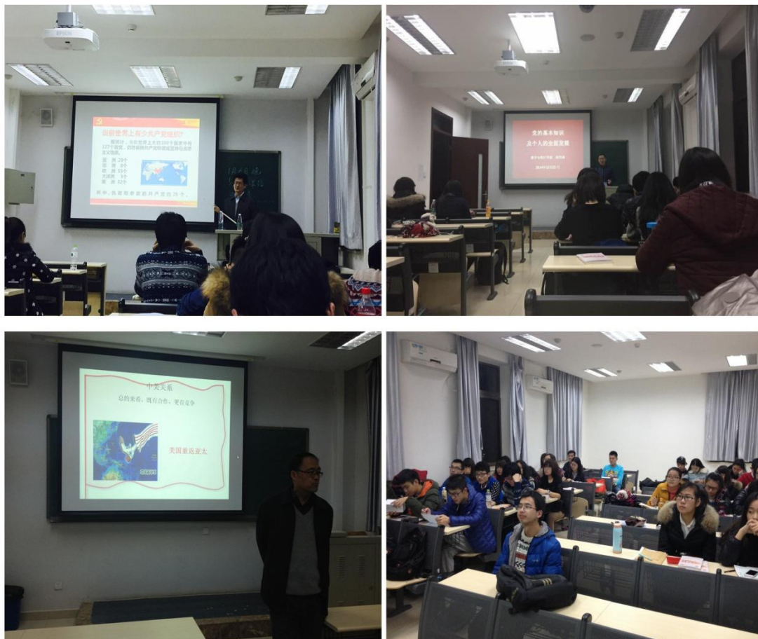
(入党积极分子进行集中培训)