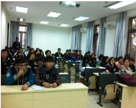
(社会主义核心价值观教育活动图片集锦)